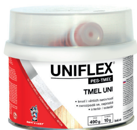
UNIFLEX PES-TMEL UNI