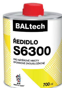
BALTECH ŘEDIDLO S6300