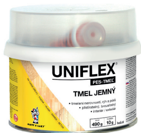
UNIFLEX PES-TMEL JEMNÝ