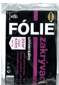
BAL zakrývací fólie