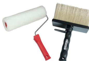
BALTOOL aplikační nářadí