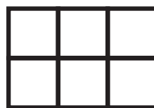
pod obklady a dlažbu