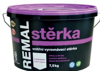
REMAL STĚRKA V5010