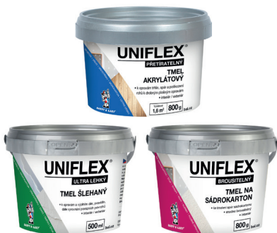
UNIFLEX TMEL AKRYLÁTOVÝ UNIFLEX TMEL NA SÁDROKARTON UNIFLEX TMEL ŠLEHANÝ