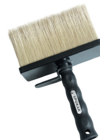
BALTOOL aplikační nářadí