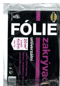
BAL zakrývací fólie