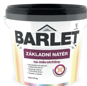
BARLET NÁTĚR ZÁKLADNÍ NA MIKROTRHLINY V4012