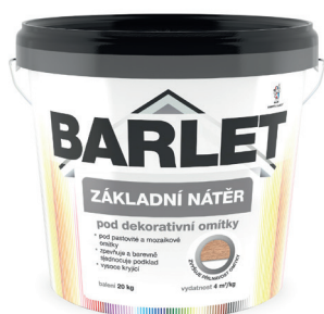
BARLET NÁTĚR ZÁKLADNÍ POD DEKORATIVNÍ A MOZAIKOVÉ OMÍTKY