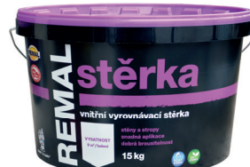
REMAL STĚRKA V5010