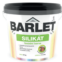
BARLET SILIKÁT BARVA FASÁDNÍ V4015