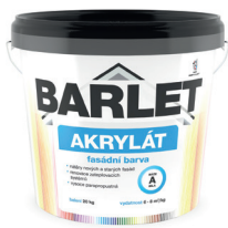
BARLET AKRYLÁT BARVA FASÁDNÍ V4013