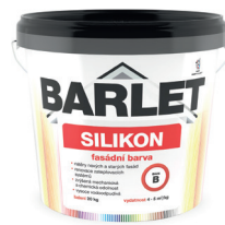
BARLET SILIKON BARVA FASÁDNÍ V4018