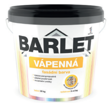
BARLET VÁPENNÁ BARVA FASÁDNÍ V4019