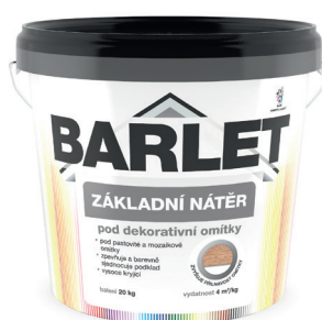
BARLET NÁTĚR ZÁKLADNÍ POD DEKORATIVNÍ A MOZAIKOVÉ OMÍTKY