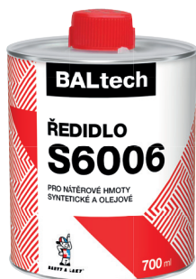
BALTECH ŘEDIDLO S6006