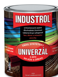
INDUSTROL UNIVERZÁL S2013