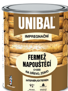
UNIBAL FERMEŽ NAPOUŠTĚCÍ O1000