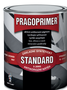
PRAGOPRIMER STANDARD S2000