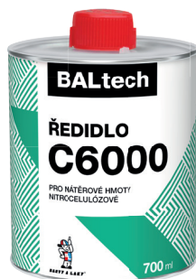
BALTECH ŘEDIDLO C6000