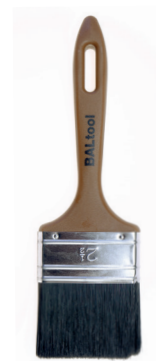
BALTOOL lazurovací štětec