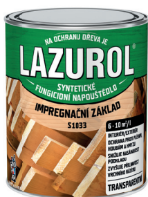
LAZUROL ZÁKLAD IMPREGNAČNÍ S1033