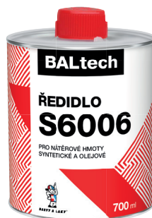
BALTECH ŘEDIDLO S6006