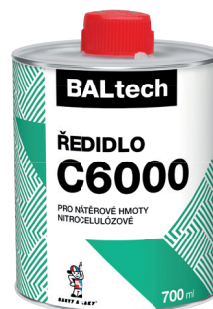
BALTECH ŘEDIDLO C6000