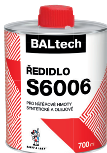
BALTECH ŘEDIDLO S6006