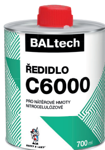
BALTECH ŘEDIDLO C6000