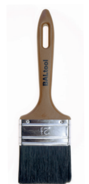
BALTOOL lazurovací štětec