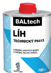
BALTECH LÍH TECHNICKÝ P6413