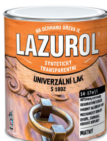
LAZUROL LAK UNIVERZÁLNÍ S1002