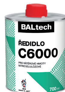
BALTECH ŘEDIDLO C6000