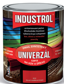
INDUSTROL UNIVERZÁL S2013