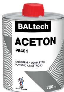
BALTECH ACETON P6401