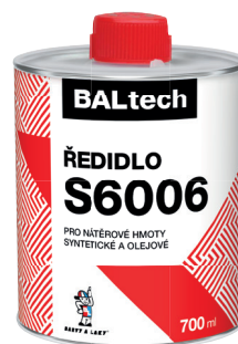
BALTECH ŘEDIDLO S6006