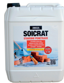
SOICRAT PENETRACE STAVEBNÍ