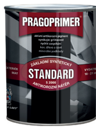
PRAGOPRIMER STANDARD S2000