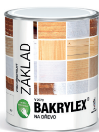
BAKRYLEX PRIMER V2070