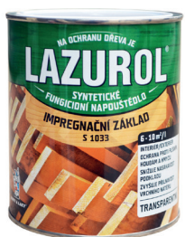
LAZUROL ZÁKLAD IMPREGNAČNÍ S1033