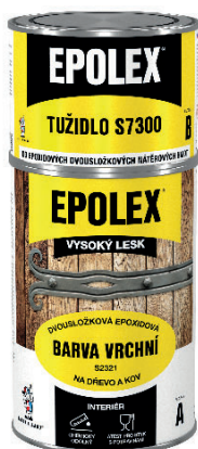
0,70 kg barvy + 0,24 kg tužidla