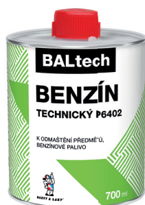
BALTECH BENZÍN TECHNICKÝ P6402