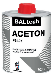
BALTECH ACETON P6401