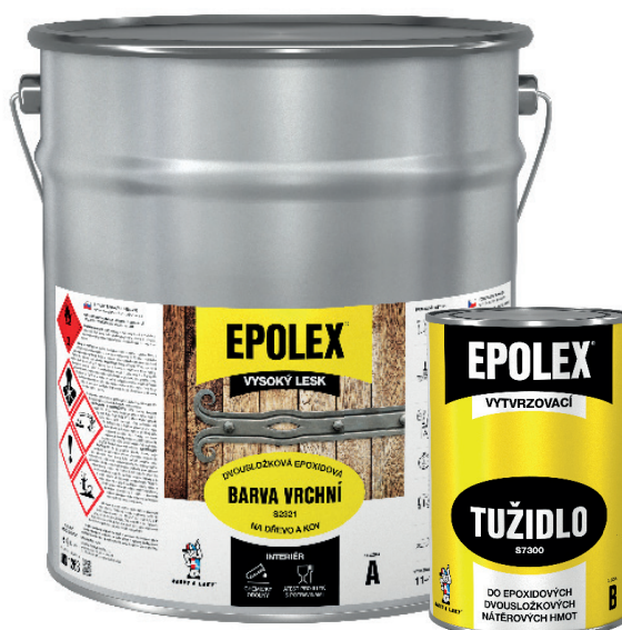
9 kg barvy + 3 kg tužidla