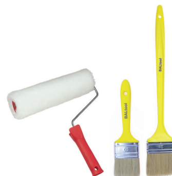
BALTOOL válečky a štětce