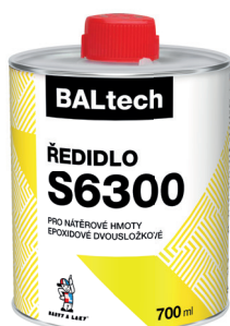
BALTECH ŘEDIDLO S6300